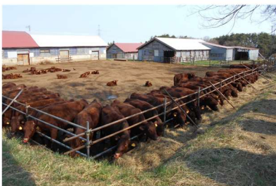
旧畜産振興センター