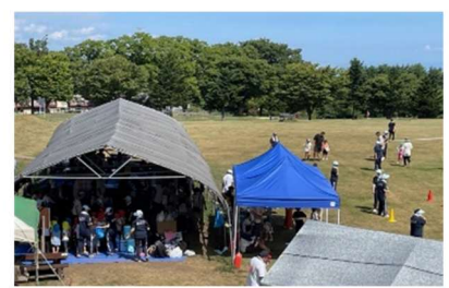
青森市八甲田憩いの牧場