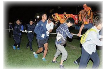
火おこしロープの引き合い