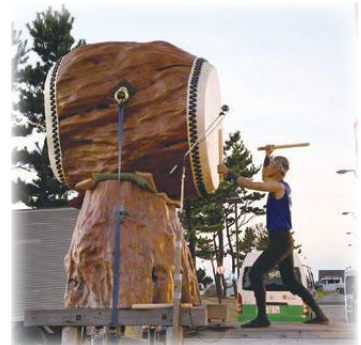
屋久杉大太鼓「神鼓」