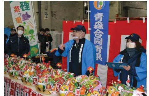
画像は、本年1月5日の初せり式