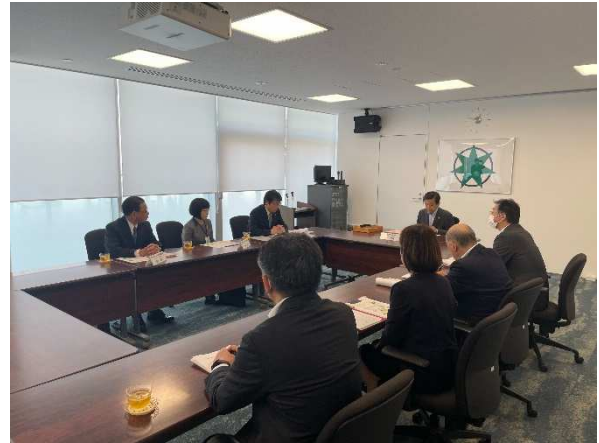
▲活動報告の様子（令和 5 年度）