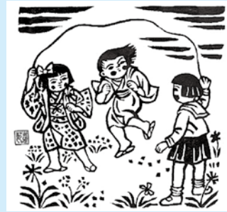
▲佐藤米次郎「なわとび」(木版)