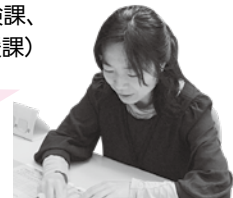
感染症対策課 予防接種スタッフ