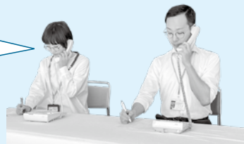
保健予防課 精神保健福祉士