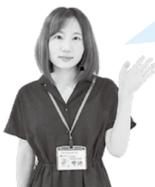
国保医療年金課 甲地