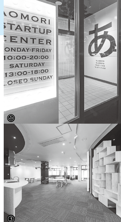
① 駅前公園側エントランス ② スからの眺め④空間を仕切ることで

イベント等は中止・延期・変更となる場合がありますので、最新情報は、お問合せ先にご確認ください。