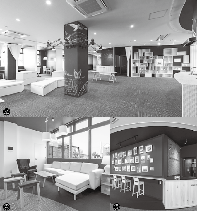
②カフェのような落ち着いた開放的なスペース③古川側エントランス個室としての利用も⑤カウンターはワークスペースにも最適