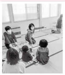
▲親子での遊びの場における支援活動