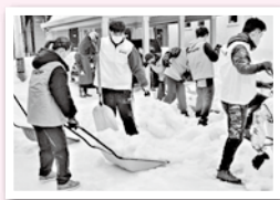
▲ひとり暮らし高齢者世帯除雪奉仕活動