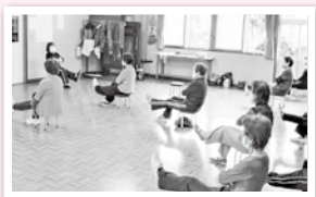
▲こころの縁側づくりでの活動