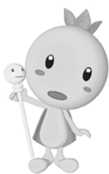
青森市環境保全キャラクター 地球の王子様「エコル」