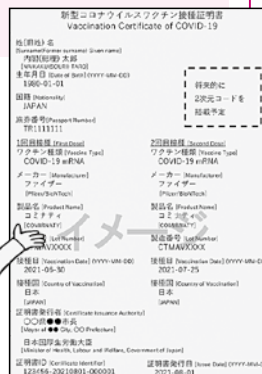
接種証明書イメージ

証明書発行は、接種記録を確認するため、申請から発行まで時間を要する場合があります。余裕をもって申請するようお願いいたします。