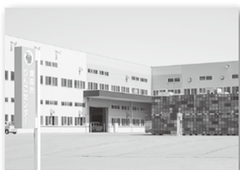
青森市りんごセンター