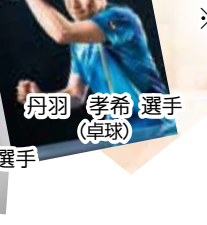
丹羽 孝希 選手(卓球)