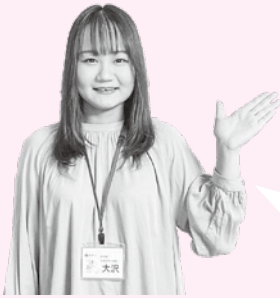
国保医療年金課 大沢

後期高齢者医療制度に加入しているかたには、8月1日(日)から使用する被保険者証を7月下旬に郵送します。