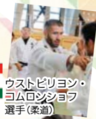
ウストビリオン・ヨムロンシヨフ選手(柔道)

青森市地域スポーツ課オリンピック・パラリンピック推進室 (☎017-718-1895)