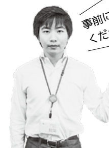
農業委員会事務局 館岡