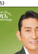
水谷 隼 選手(卓球)