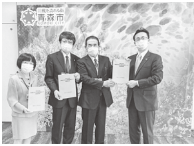
5月20日に青森市子どもの権利擁護委員から市長へ活動報告を行いました。

市では、いじめ、体罰など、子どもの権利侵害に関する相談を受け、その救済と権利の回復を図るための機関として、「子どもの権利相談センター」を設置しています。このたび、令和2年度の活動を報告書にまとめました。報告書は市役所各庁舎、各支所・市民センターなどでご覧いただけるほか、市ホームページにも掲載していますので、ぜひご覧ください。