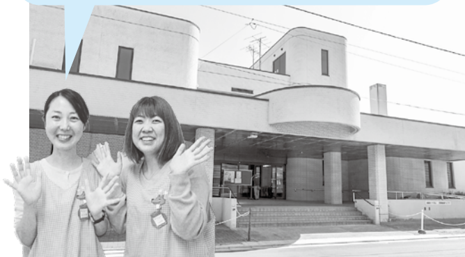
あおもり親子はぐくみプラザ 保育士

7月の『子ども発達相談』は、「総合福祉センター」で開催します。あおもり親子はぐくみプラザではありませんので、お間違えのないよう、ご注意ください。