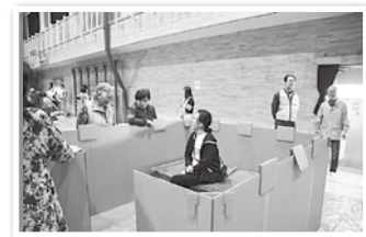
▲段ボールベッドを使った防災訓練の様相