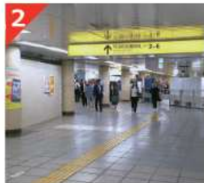
3～6番出口方向の改札を目指します。