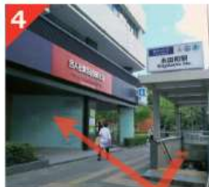
地上へと出てすぐ目の前のビルがビジョンセンター永田町です。