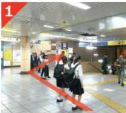
有楽町線・半蔵門線・南北線「永田町駅」3番出口が目的の出口です。