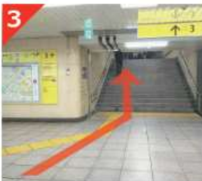
改札を出て右手へ進み、その先の階段を登ります。