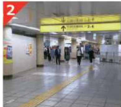
3～6番出口方向の改札を目指します。