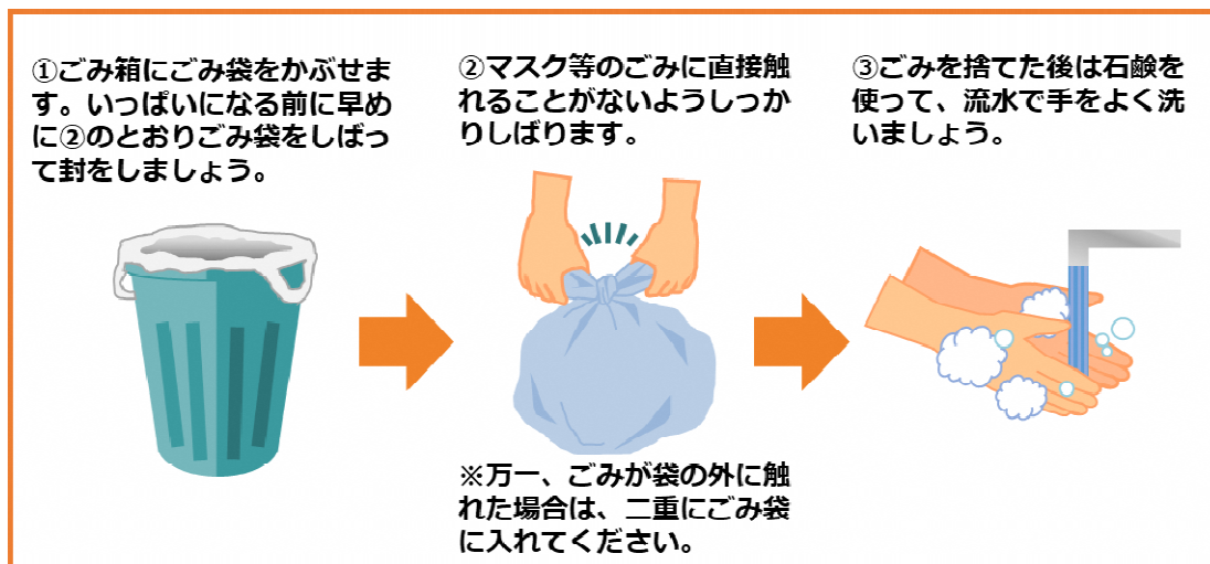
図1 新型コロナウイルス等の感染症の感染者又はその疑いのある方の使用済みマスク等の捨て方(環境省)