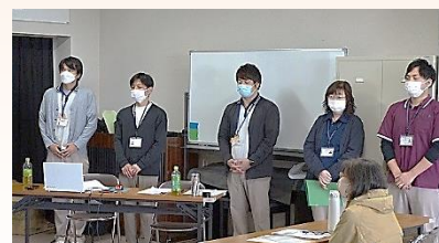
養成講座の講師陣の方々

認知症の人に対して、周りの人の対応として「特性を理解し、自然な気遣いを。本人が得意なことやできることでは、大いに頼りにする。」ことが挙げられました。講座では「周りの心遣い」という寸劇もあり、大いに参考になりました。