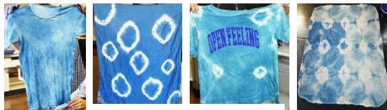
染めあがった作品の数々

参加者からは「なかなかできない体験ができて、良い時間を過ごせました」「きれいにできたので夏休みの工作としてみんなにみせたい」「思ったよりきれいに染まっていたのでうれしかった」等の感想をいただきました。